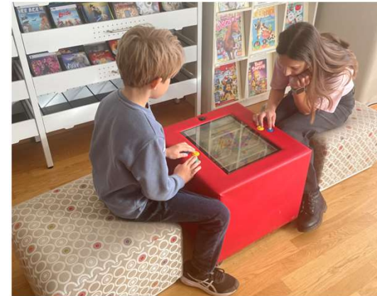
Die Kuti-Spielbox zu Besuch bei uns