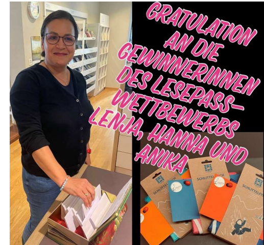
Auslosung der Lesepass-Gewinner