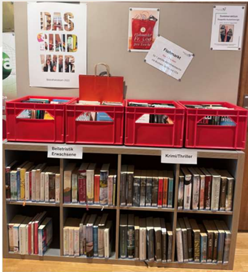
Flohmarkt: Wir schaffen Platz für neue Medien