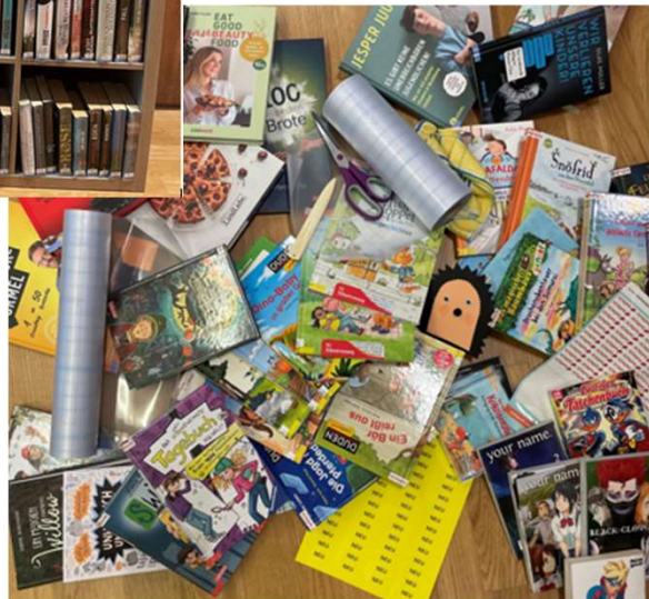
Aufbereitung der neuen Medien