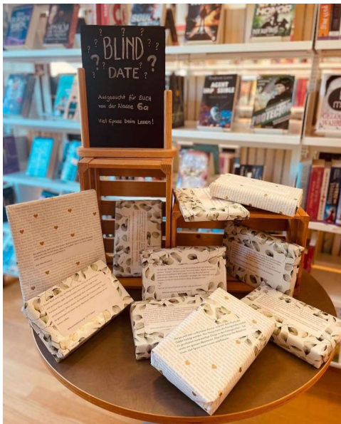
Blind-Date der 6.Klässler